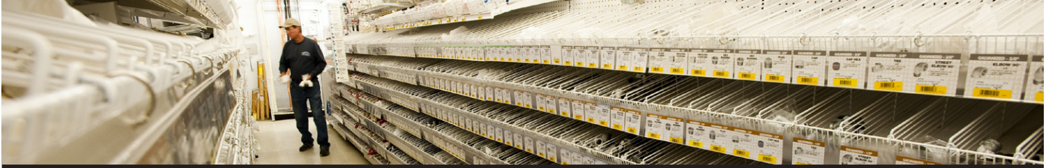
Cliente de CCR, Ace Hardware & Pagosa Mountain Home Company, Pagosa Springs, CO